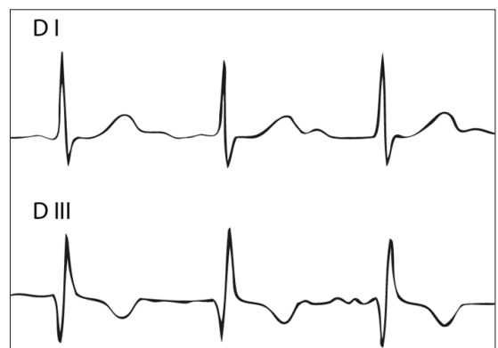
Figura 2. Trazado electrocardiográfico característico de un patrón S1Q3T3 sugerente de hipertensión pulmonar. Se observa onda S en D I, onda Q en D III y onda T negativa en D III.

Entre las mujeres de edad reproductiva aproximadamente 8% de los cuadros de hipertensión pulmonar se asocian con el embarazo. Es posible que el embarazo inicie la hipertensión pulmonar en algunas mujeres, sin embargo, es más probable